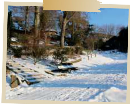
Le parc Imbert sous la neige en février 2012