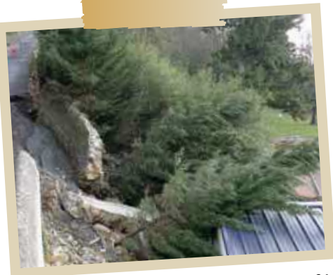
Effondrement route de Crevant en décembre 2004

Le Plan Communal de Sauvegarde (PCS) est un outil au service des Maires pour faire face aux problèmes de sécurité civile. Ce plan s'intègre dans l'organisation générale des plans de secours, qui relèvent toujours de la responsabilité du Préfet. Il prend en compte l'accompagnement et le soutien aux populations, ainsi que l'appui aux services de secours.