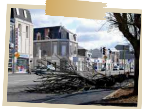
Tempête Xynthia en février 2010

Certaines villes sont confrontées à des risques majeurs , c'est à dire des phénomènes naturels ou technologiques dont les conséquences pourraient occasionner des dommages importants.